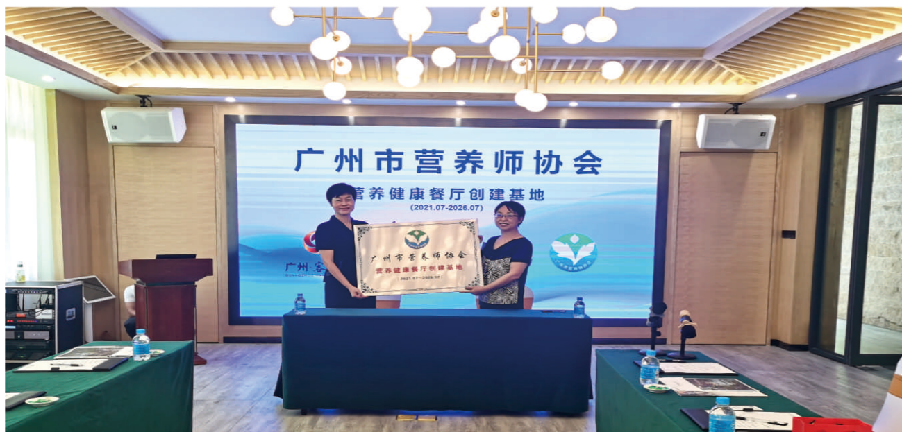
广州市营养师协会

广州市客天下文化旅游发展有限公司是广东鸿客实业集团旗下为投资开发客天下·广州国际旅游度假区（森林康养文旅综合体）而设立的一级运营平台。客天下·广州国际旅游度假区位于广州市从化区江埔街，毗邻从化主城区，规划面积6000亩，总投资50亿元，以“爱与森林”为主题，重磅打造九大业态，包括森林康养产业、文旅产业、中药产业、桃花产业、农电商产业、教育产业、婚庆产业、文化产业、儿童娱乐产业，充分发扬客天下工匠精神，致力于打造集森林文化、森林体验教育、森林康养、丛林探险等为一体的国际休闲健康旅游目的地，打造粤港澳大湾区标杆文旅项目。